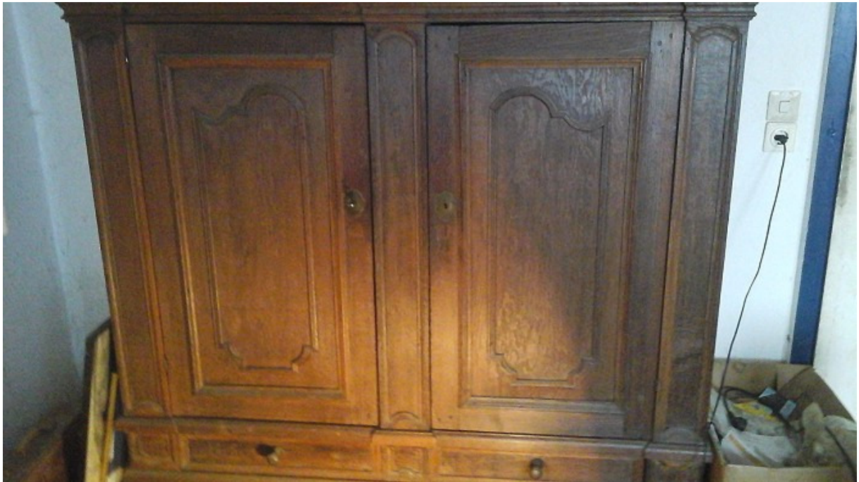
Abbildungen: Barock-Eichenholz-Schrank H.S & E.S. Schürmann mit Details: