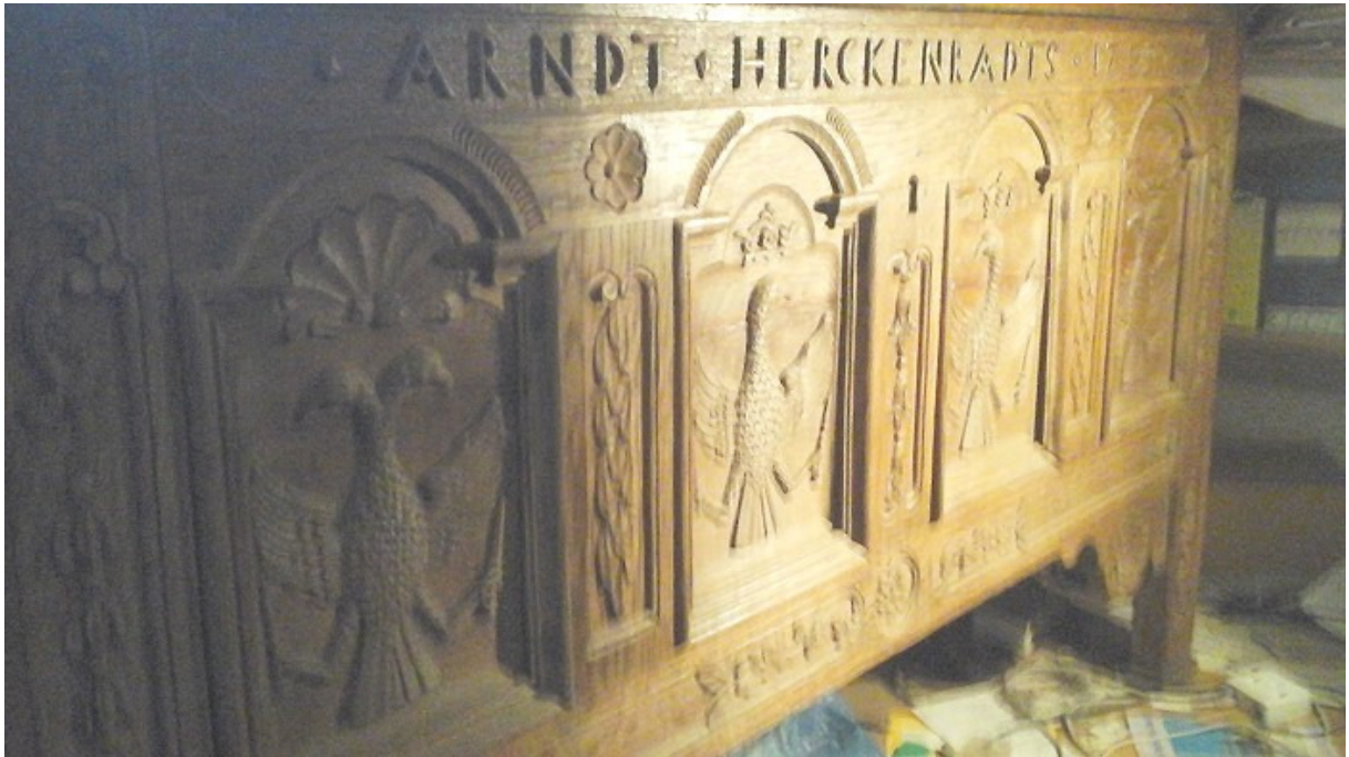
Abbildungen von einer Eichenholz-Truhe, „ARNDT HERCKENRADT 1789“ mit Details (aus Privatbesitz):