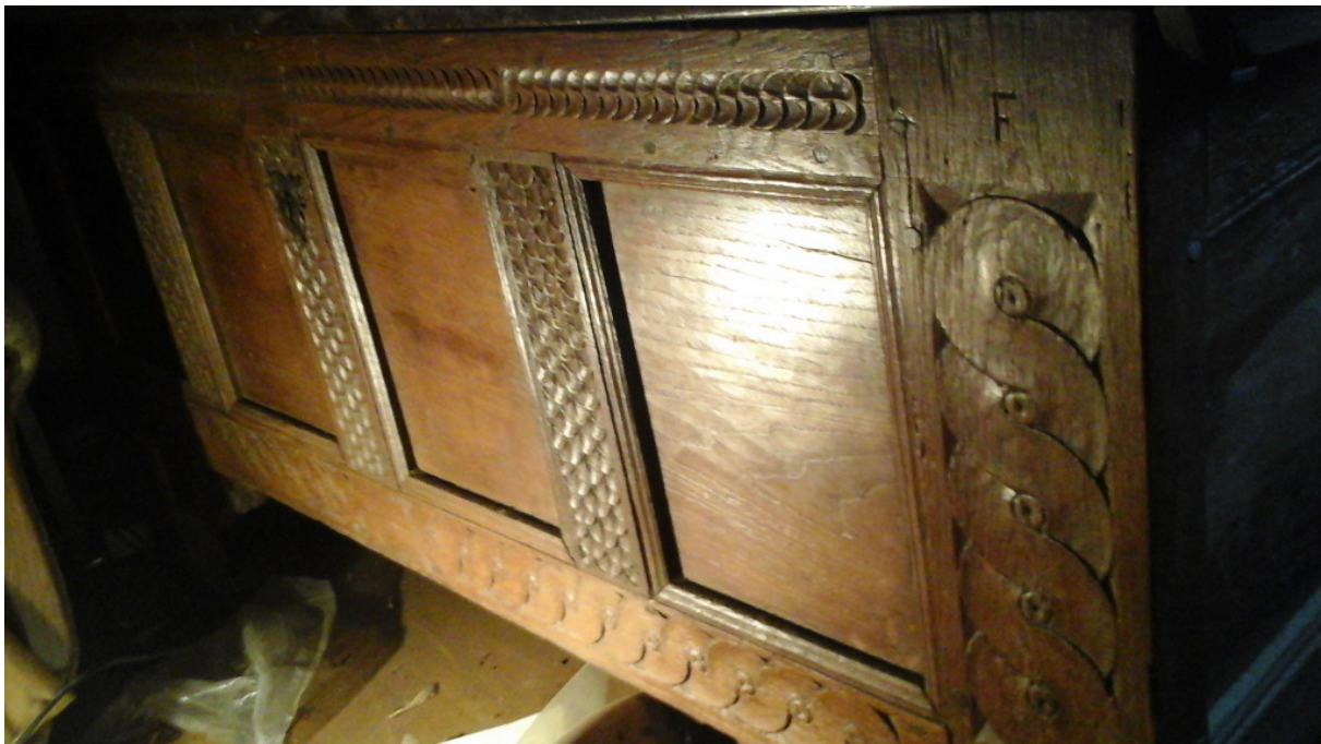
Abb.: Geschnitzte Eichentruhe „D... F“, 18. Jh.